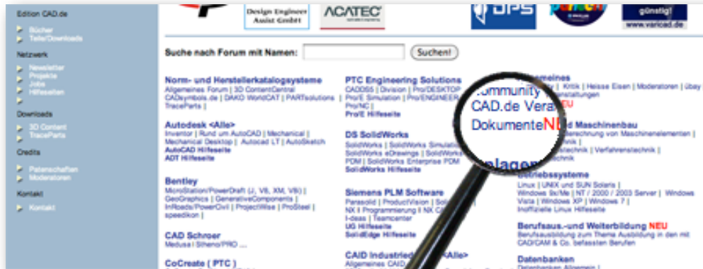
Unter Allgemeines ist das Dokumente -Forum zu finden

Da die Dokumente in einem einzigen Forum abgespeichert werden, sind sie nicht auf die unterschiedlichen Produktbereiche verteilt. Das hilft nicht nur bei der Suche nach einem Dokument, sondern erleichtert auch die Ablage für Dinge, die sich nicht einer bestimmten Anwendung zuordnen lassen.