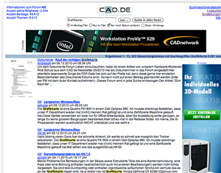
Dokumente stehen immer an vorderer Position in den Suchergebnissen

Alle Treffer aus dem Dokumente-Forum werden in den Suchergebnissen immer an vorderster Position eingereiht: